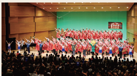
習志野市立習志野高等学校