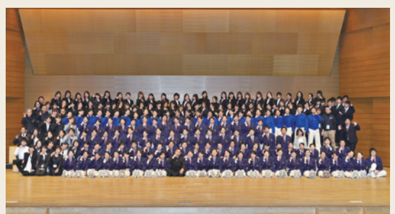
船橋市立船橋高等学校