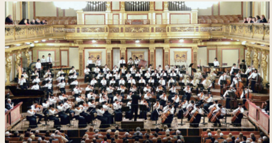
千葉県立幕張総合高等学校