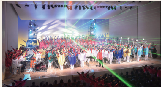
柏市立柏高等学校